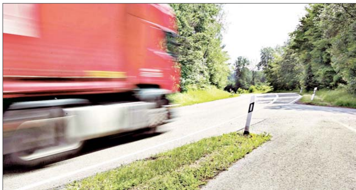
Plötzlich ist Schluss mit der eigenen Fahrbahn für Radfahrer: Zwischen dem Ersinger Kreuz bei der B 10 und Birkenfeld besteht noch eine Radwegelücke, die bald geschlossen werden soll.

wenig Einfluss nehmen. Trotzdem wurde etwa der Punkt heiß diskutiert, an dem der künftige Radweg die Landesstraße nach Dietlingen kreuzen soll. Kurz vor dem sogenannten Karussell. Vor allem die geplanten Sicherheitsmaßnahmen standen im Blickpunkt. Klingt so, als sollte dort bald häufiger geradelt werden.